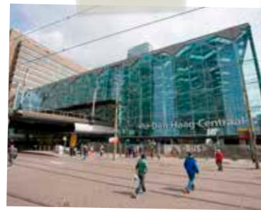
Den Haag Centraal Station