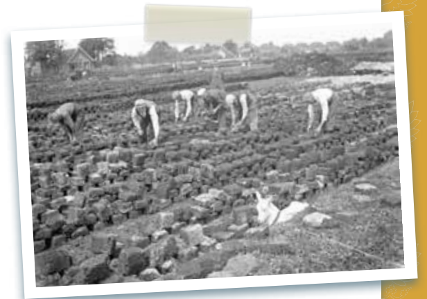
Het steken van turf