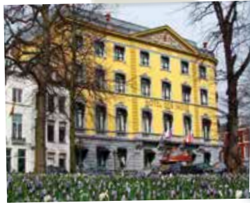
Hotel des Indes