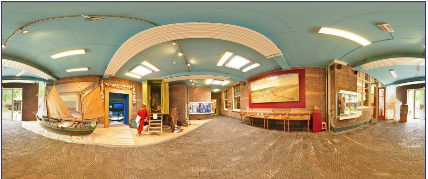
Dit is de Zeezaal van Muzee Scheveningen

Opa komt naar Bram toe. Het is tijd om naar huis te gaan. Wat was het leuk op het strand opa!: zegt Bram. Ik vond het nu nog leuker dan in de zomer! Ik ga morgen alles wat ik gevonden heb op school laten zien. 'Misschien wil de juffrouw wel met jullie naar Muzee Scheveningen': zegt opa. Daar kun je heel veel dieren uit de zee zien. Oh, zegt Bram, dat ga ik vragen! Bram is weer blij en hij is het koude weer helemaal vergeten.