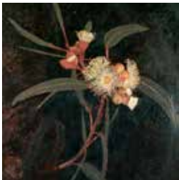
Gerrit Willem Dijsselhof, Eucalyptus, 1997-99