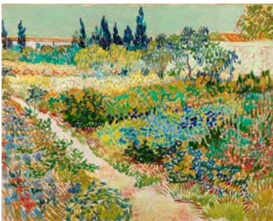
Vincent van Gogh, Tuin te Arles, 1988

› Zijn er volgens jou regels voor een kunstwerk? Leg uit. Betrek hierbij het schilderij van Vincent Van Gogh.