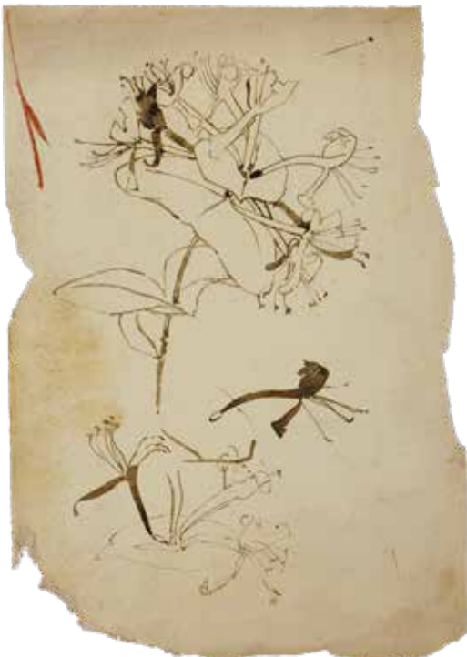
Gerrit Willem Dijsselhof, zonder titel

Dijsselhof tekende veel naar waarneming. Voordat de fotografie werd uitgevonden waren schetsen de enige mogelijkheid om te onthouden hoe dingen eruit zagen.