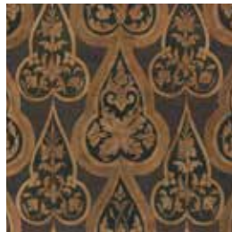
Gerrit Willem Dijsselhof, Ontwerp voor behang

› Wat is nu eigenlijk het verschil tussen kunst maken en dingen ontwerpen? Probeer dit uit te leggen. Betrek hierbij het schilderij en het ontwerp van Dijsselhof.