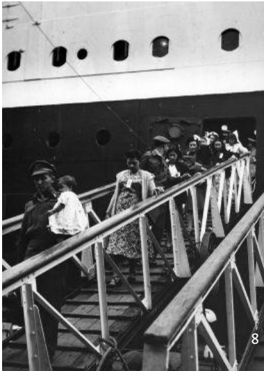
8 Aankomst van Indische bevolking in Amsterdam. (, Debarkatie van het schip de "Atlantis". Indische Nederlanders komen aan in Amsterdam. Nederland, Amsterdam, 10 juli 1950.)

De dekolonisatie (het onafhankelijk worden van koloniën) brengt een uittocht uit de Nederlandse ex-koloniën op gang. Na de eenzijdige onafhankelijkheidsverklaring van Indonesië (1945) en de officiële overdracht van de soevereiniteit (1949) verlaten tienduizenden Nederlanders dat land om politieke redenen. De eerste remigranten (remigratie is de permanente terugkeer van geëmigreerde mensen naar het geboorteland) en ook mensen die nog nooit in Nederland waren geweest zijn vooral Nederlanders die tijdens de Japanse bezetting van Indonesië in 'Jappenkampen' hebben gezeten. Ze worden gevolgd door Indische mensen en Indonesiërs van Chinese afkomst en Molukkers. In totaal trekken 280.000 (re)migranten naar Nederland.