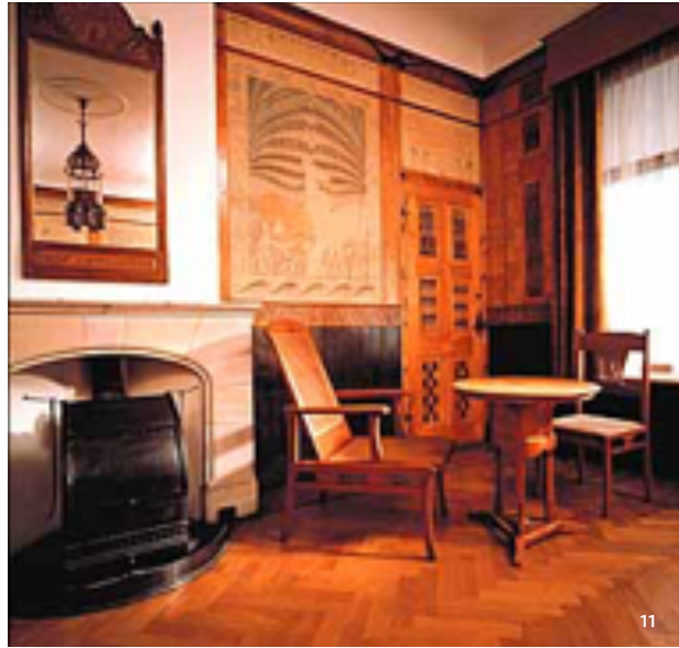
11 De Dijkshelhofkamer, 1895, tegenwoordig in het Haags Gemeentemuseum.