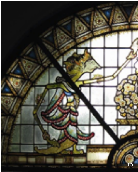
10 Glas in loodraam met batik- en wajangmotief, villa Hejmo Nia, Parkweg.