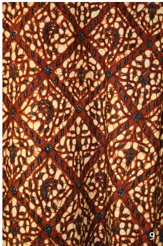
9 Gebatikte stof, uit Yogyakarta, Indonesia

In de Indische gebouwen die je gaat bekijken zijn prachtige glas in lood ramen te zien. Sommige glas in lood ramen zijn geïnspireerd op een typische kunstvorm uit Indonesië, het batikken.